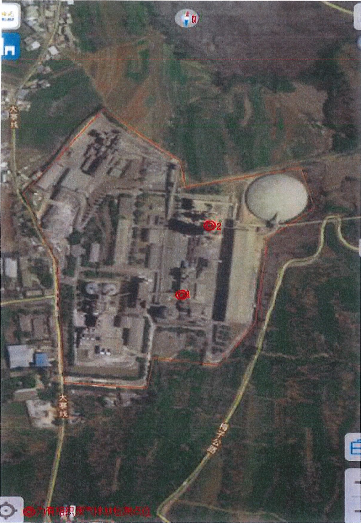
附件 1：检测点位示意图